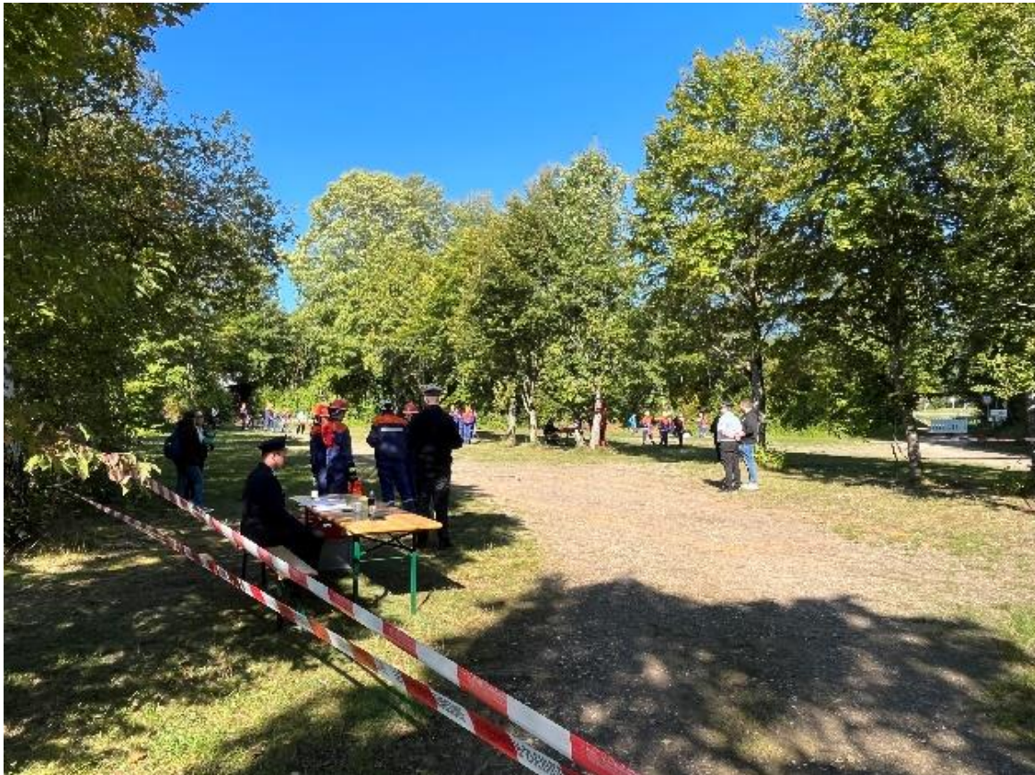
Wettkampfgelände auf dem Freibadparkplatz