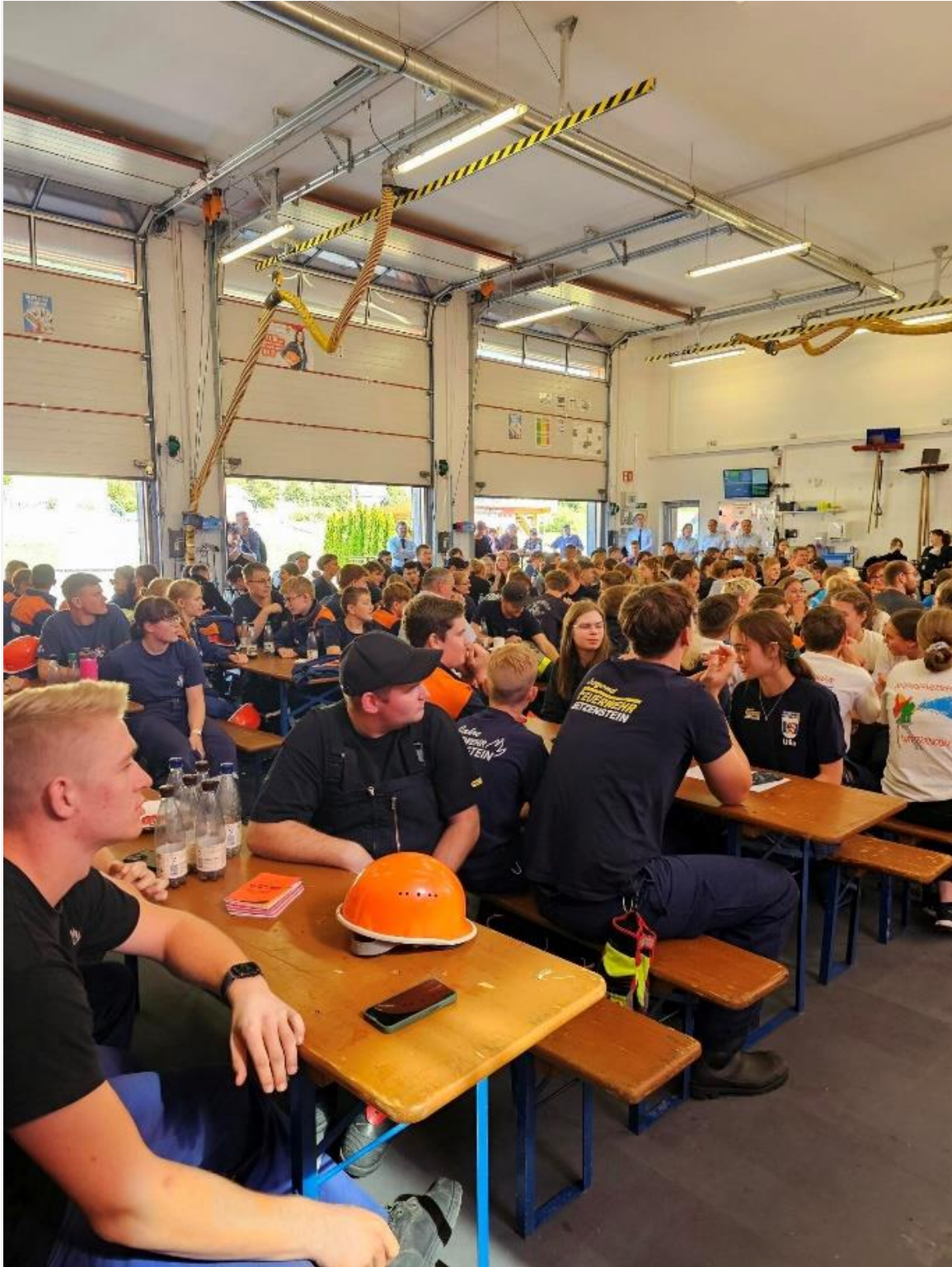
In der vollbesetzte Fahrzeughalle - warten auf die Siegerehrung