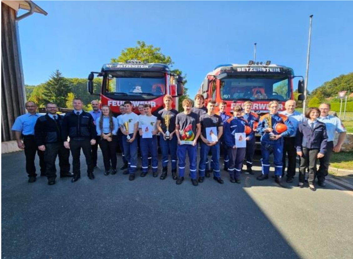
Die Siegermannschaften mit den Kreisbrandinspektoren und dem kreisjugendfeuerwehrwart